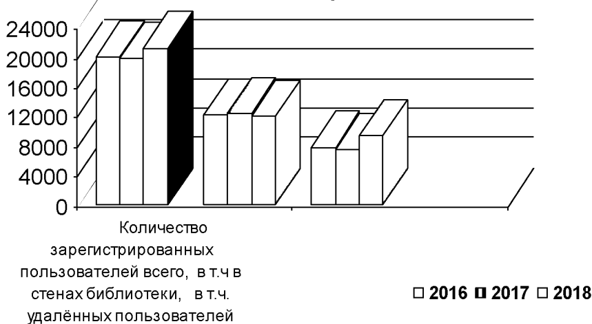
Количество зарегистрированных пользователей 2016, 2017, 2018гг. Всего, в т.ч. в стенах библиотеки, в т.ч. удалённых пользователей

Количество зарегистрированных пользователей в 2018 году 21 255. Обращает на себя внимание рост показателя количества удалённых пользователей в 2018 году - 9340 (+ 1 796), в то же время в 2018 г. немного уменьшилось зарегистрированных пользователей в стенах библиотеки 11915 (- 402) в сравнении с показателями 2017 года.